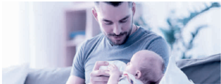
Vaterschaftsurlaub: innert sechs Monaten nach der Geburt zu beziehen.

Das Unternehmen muss dem Vater zehn arbeitsfreie Tage gewähren und hat für diese Zeit Anspruch auf 14 Taggelder. Es ist Sache des Arbeitgebers, bei der Ausgleichskasse – welche auch die EO-Beiträge abrechnet – den Antrag auf die Vaterschaftsentschädigung zu stellen. Der Antrag sollte aber erst gestellt werden, wenn der Arbeitnehmer den ganzen Vaterschaftsurlaub bezogen hat und der Arbeitgeber dies mit dem Antrag bestätigen kann. Die Auszahlung der Vaterschaftsentschädigung erfolgt dann nachgelagert